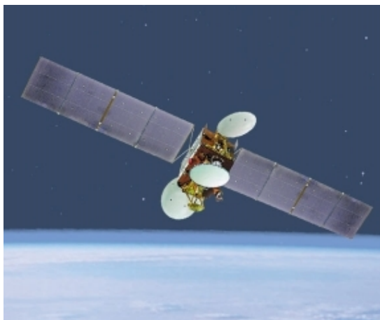
Автоматические космические системы