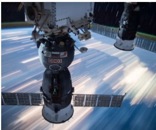
Пилотируемые космические системы