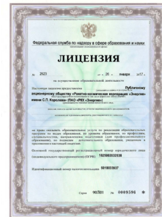
Лицензия на ведение образовательной деятельности №2523 от 26.01.2017 бессрочная