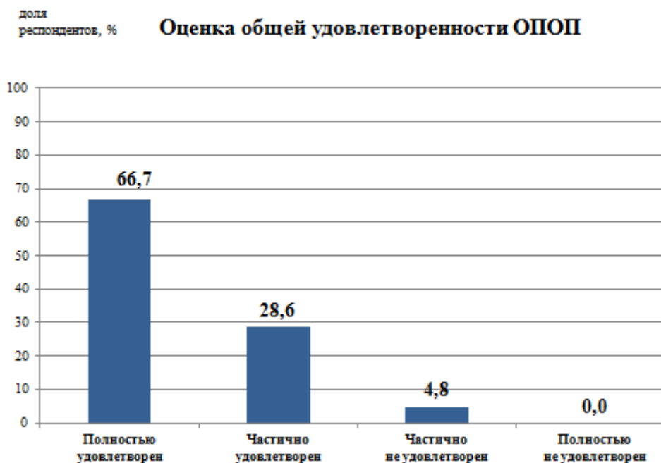
Рис.1 - Удовлетворенность обучающихся образовательной программой в целом

Показатели общих характеристик вуза (инфраструктура университета, социально-культурные и бытовые условия, репутационные характеристики вуза) оценены респондентами достаточно высоко – средний балл 4,4 из 5 максимально возможных баллов. Наиболее высоко респонденты оценили доступность информации о деятельности Университета в социальных сетях и мессенджерах.