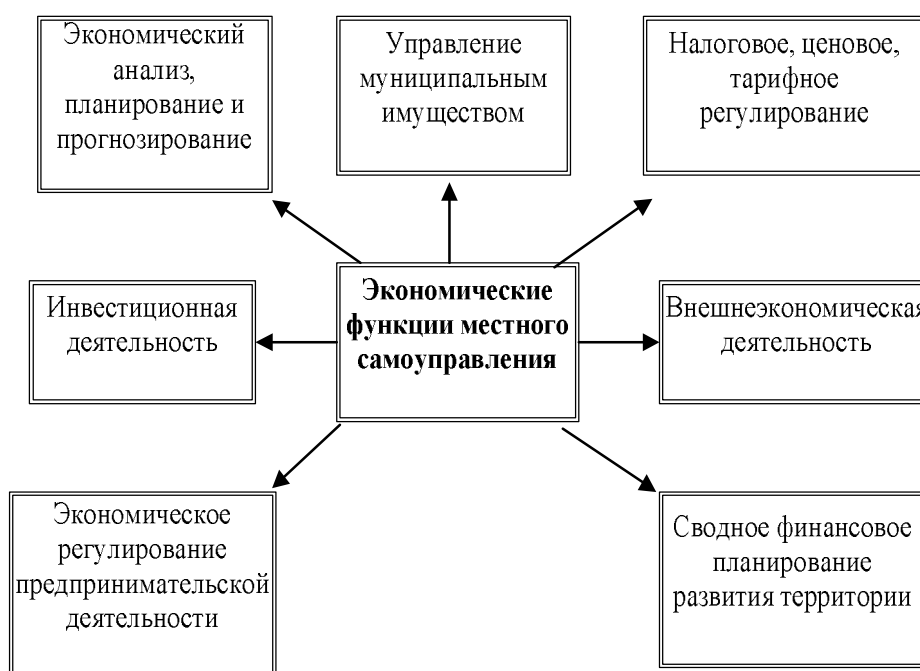
Рис. 2. Экономические функции местного самоуправления

Чертеж (рисунок, схему, диаграмму, гистограмму и т. п.) по возможности следует выполнять на одной странице. Если чертеж на ней не умещается, то допускается его переносить на последующие страницы. Тематическое наименование чертежа помещают на первой странице.