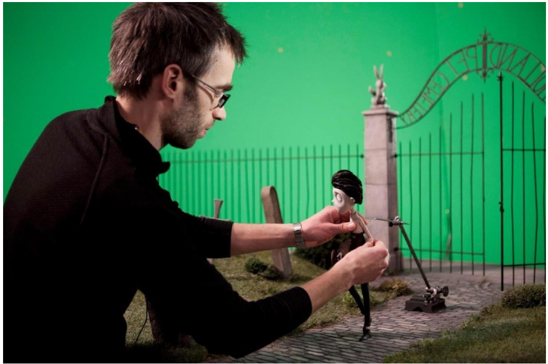
Рис. 1.2.5. Создание мультфильма «Труп невесты». Смешанная анимация.