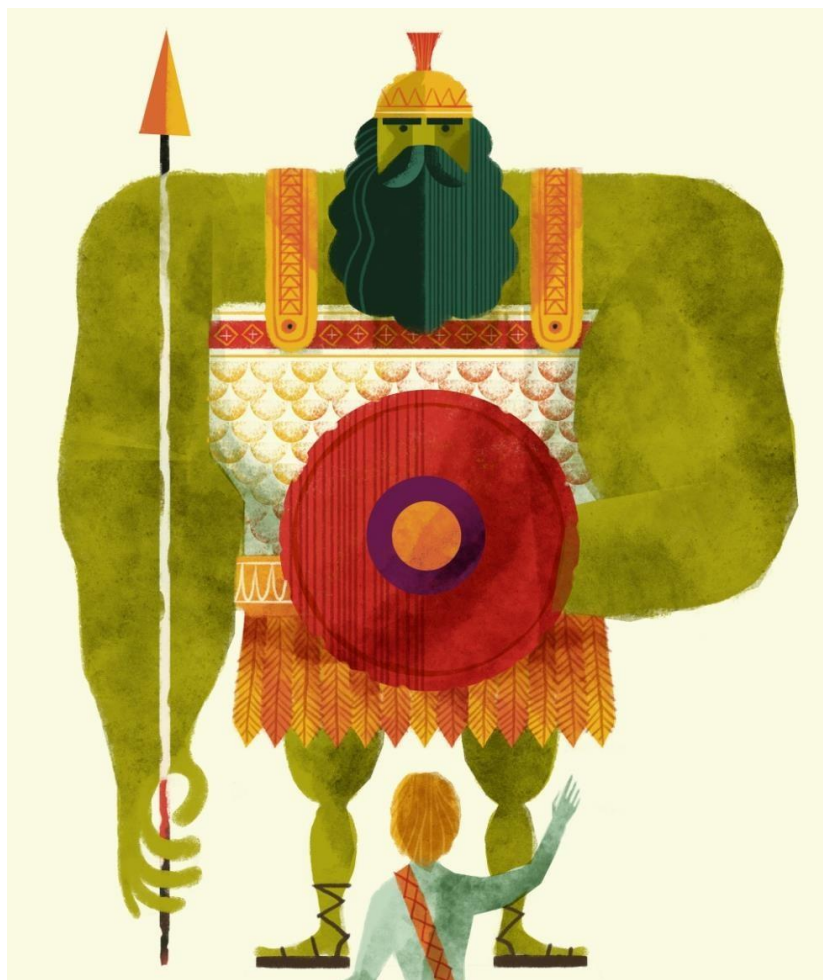
Рис. 2.1.15. Анимационный короткометражный фильм «Самая большая история».