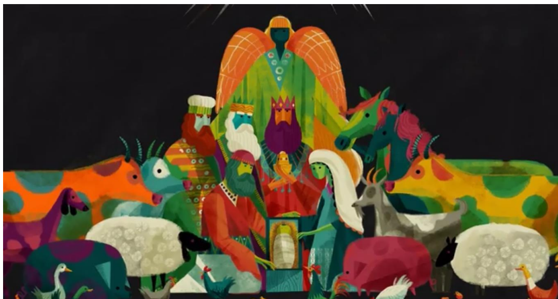
Рис. 2.1.14. Анимационный короткометражный фильм - «Самая большая история».