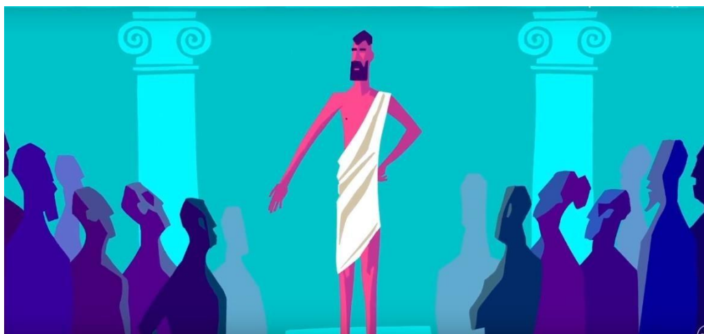
Рис. 1.2.13. Мультфильм производства компании TED «Философия стоицизма».