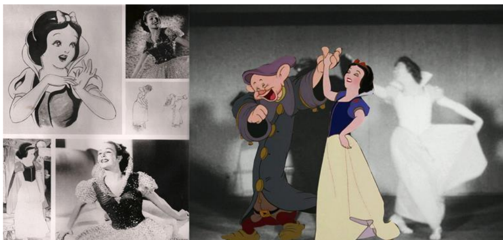
Рис. 1.2.2. Ротоскопирование.