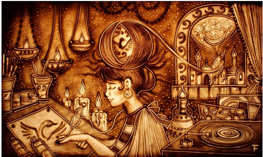
Рис. 1.2.6. Песочная анимация.