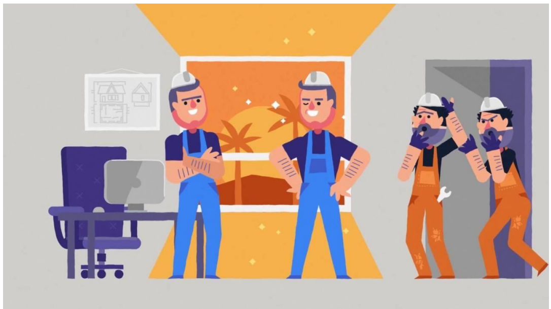
Рис. 1.2.8 Шейповая анимация.