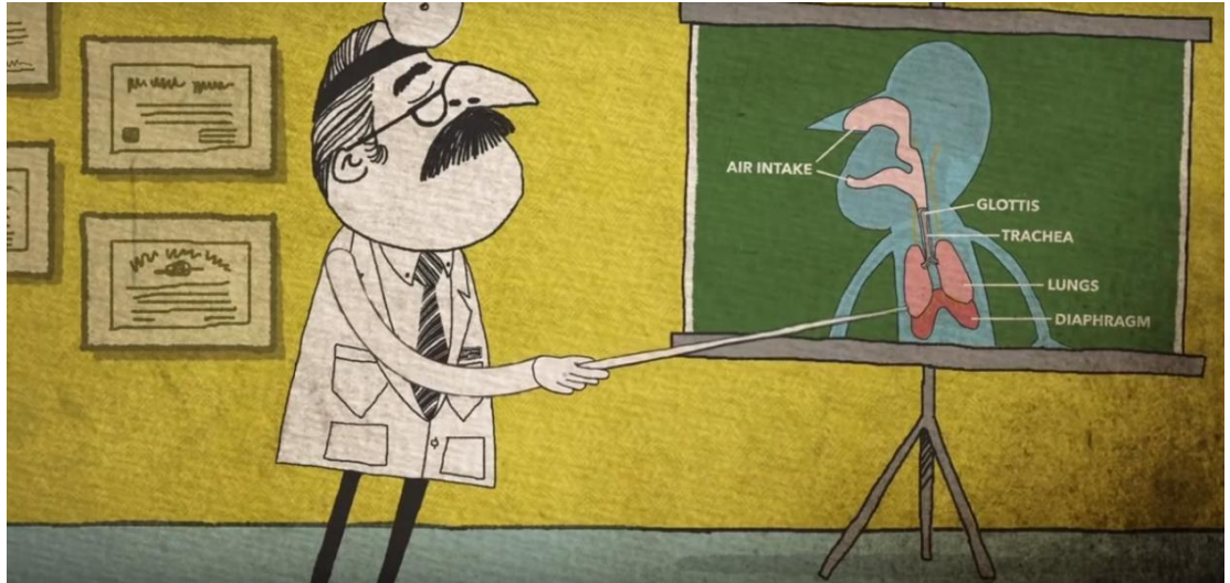
Рис. 1.2.11. Мультфильм производства компании TED «Почему происходит икота».