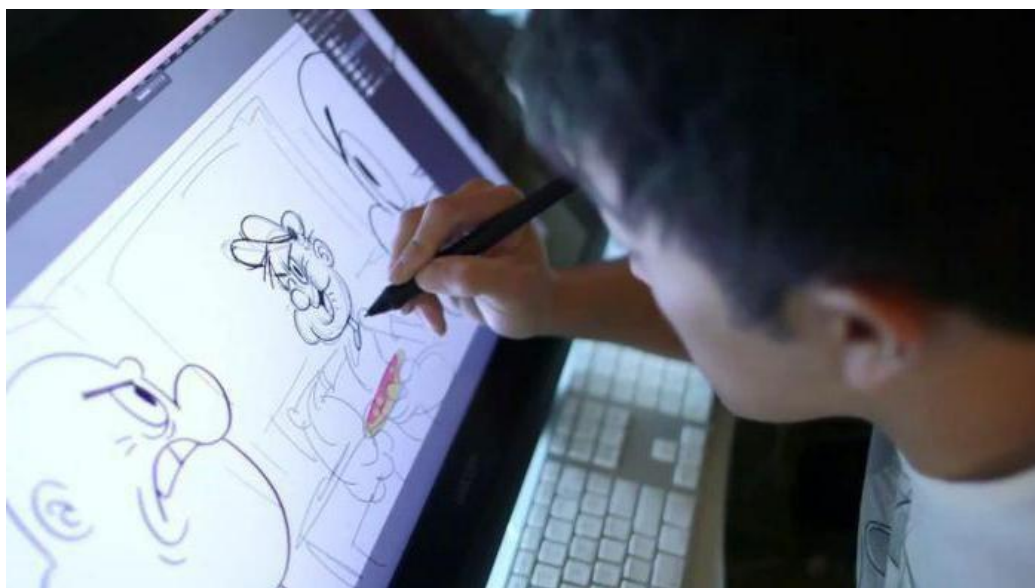
Рис. 1.2.1. Создание рисованной анимации.