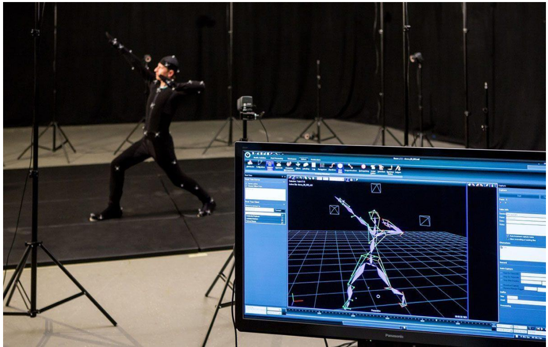
Рис. 1.2.7. Запись движения. Компьютерная анимация.