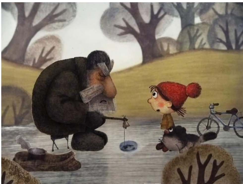
Рис. 1.2.4. Мультфильм «The Tiny Fish» 2008 г. Анимация перекладка.