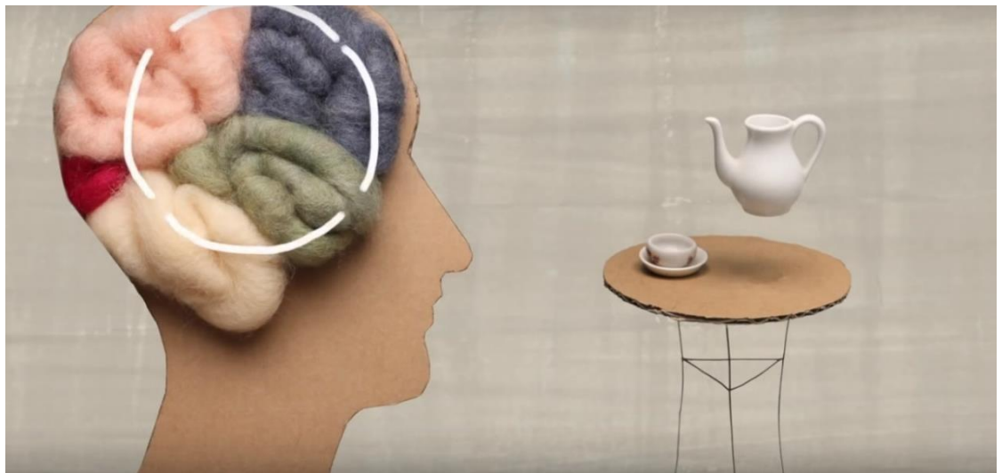
Рис. 1.2.12. Мультфильм производства компании TED «Существует ли телекинез?».