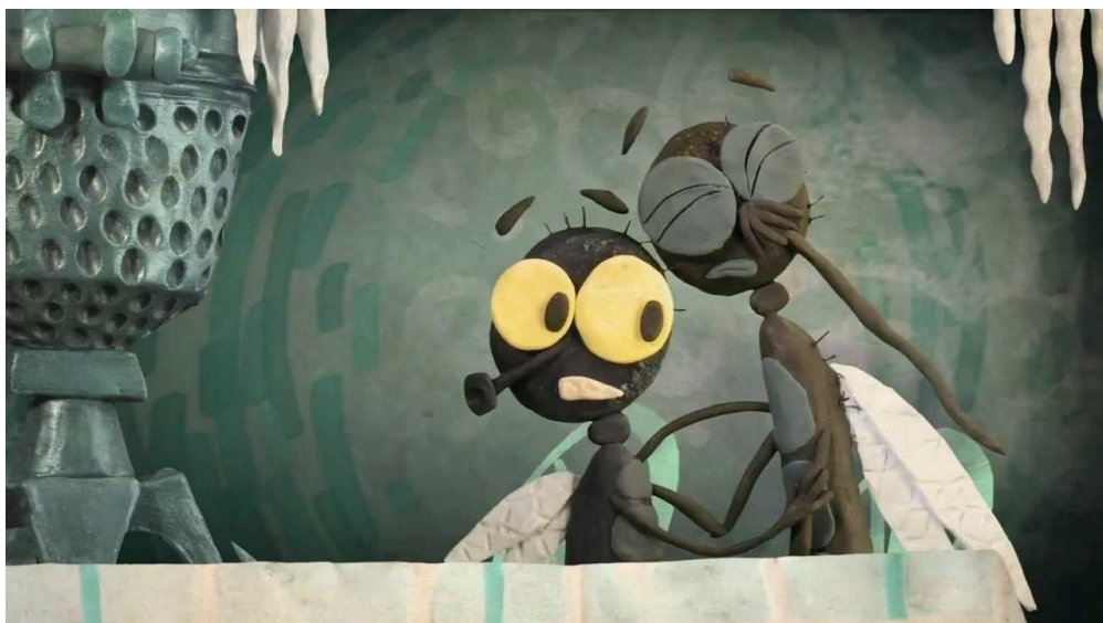
Рис. 1.2.3. Фрагмент из мультфильма «Гора самоцветов: Теремок». Пластилиновая анимация.