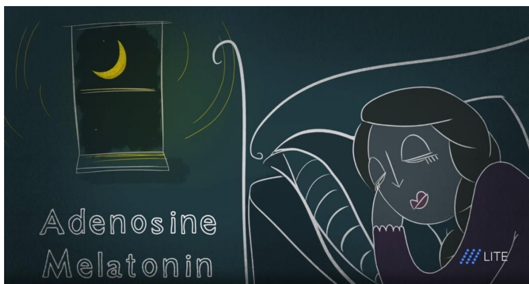
Рис. 1.2.14. Мультфильм производства компании TED «Что будет, если не спать».