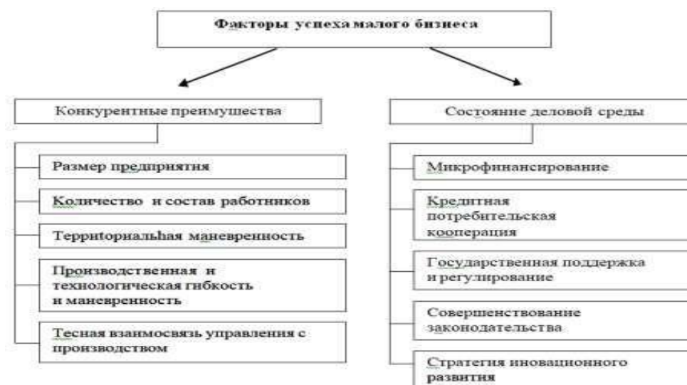
Рис. 1. Факторы успеха малого бизнеса