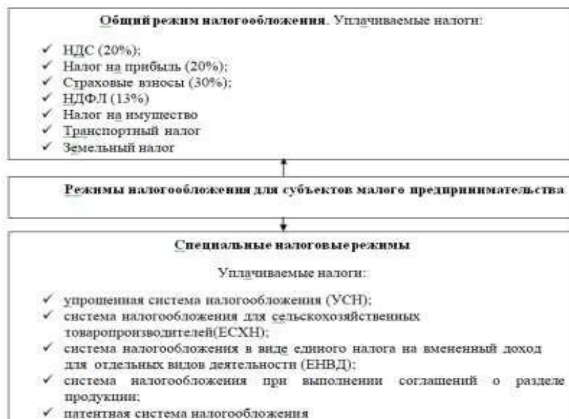
Рис. 4. Режимы налогообложения для субъектов малого предпринимательства

Налоговой базой при исчислении ЕСН, являются любые выплаты и вознаграждения, исчисляемые налогоплательщиков в пользу физических лиц по трудовым и гражданско – правовым договорам по выполнению работ, оказанию услуг и авторским договорам.