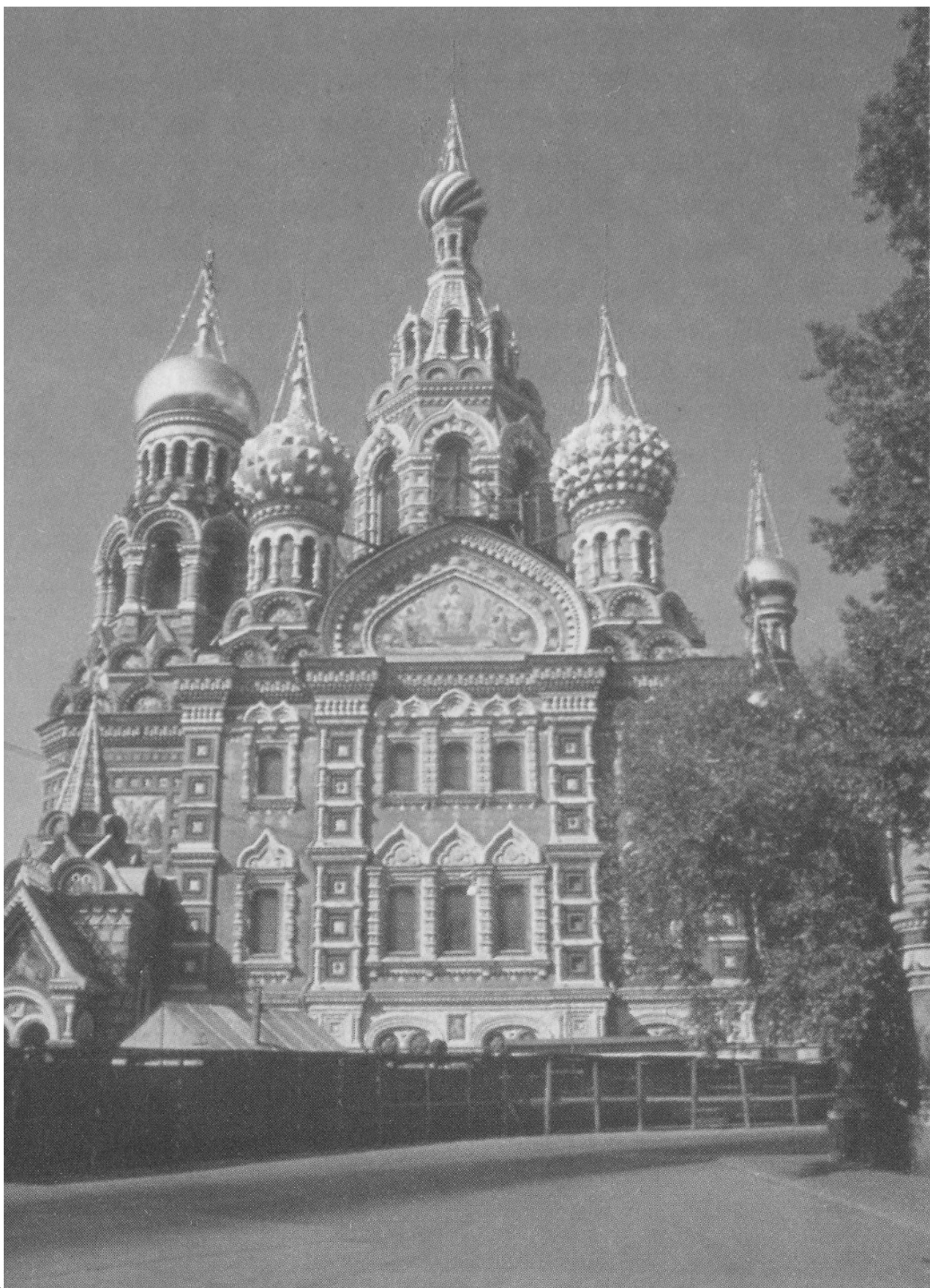
Рис. 3. Храм Воскресения Христова («Спас на крови»)