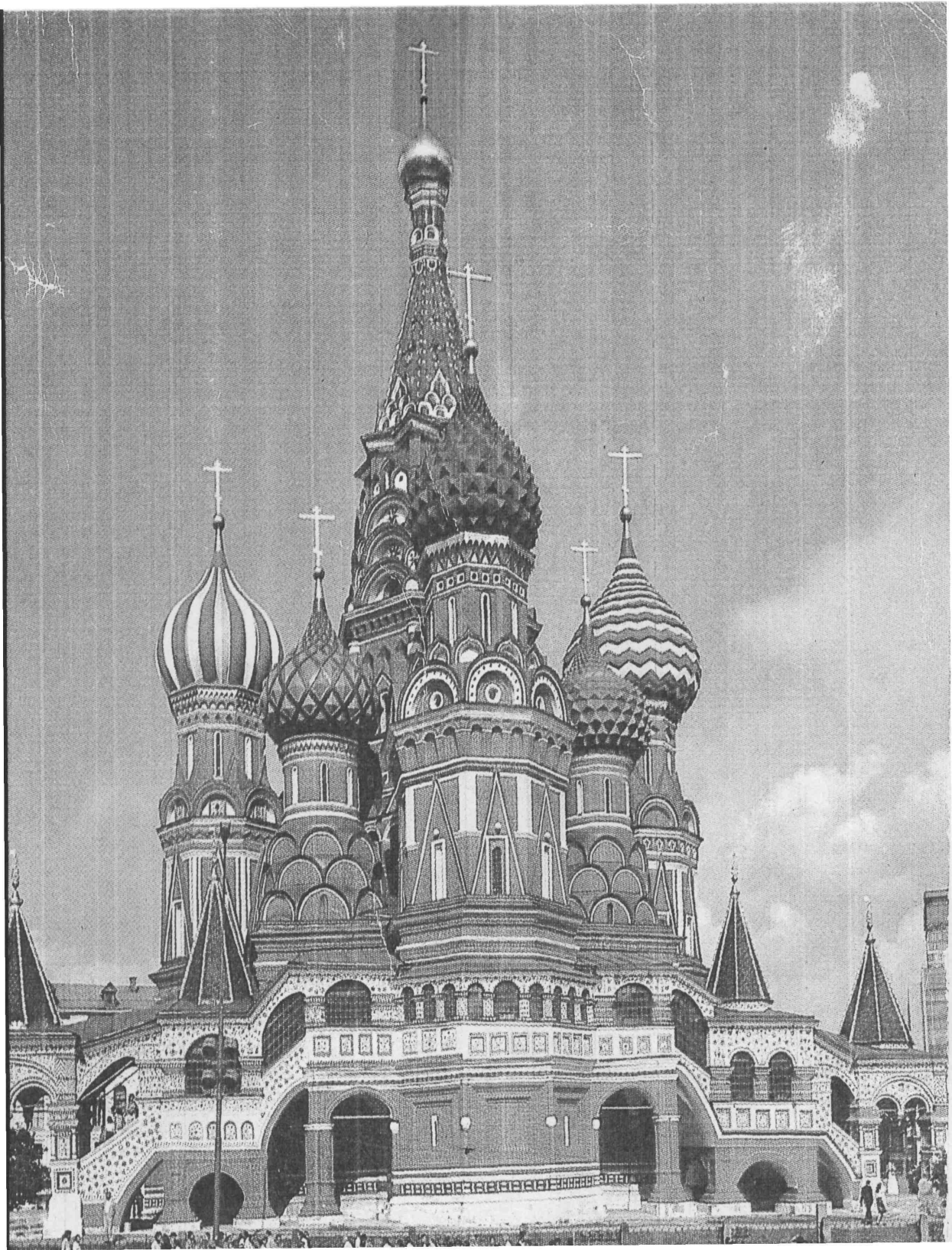
Рис. 1. Собор Василия Блаженного