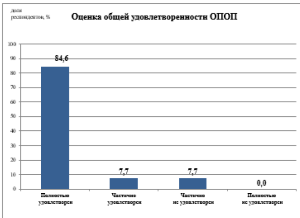
Рис.1 - Удовлетворенность обучающихся образовательной программой в целом

В целом качеством реализации образовательной программы удовлетворены полностью или частично 92,3% участников опроса, остальные респонденты указали на частичную неудовлетворённость. (рис.1).