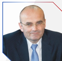
Василий Буренок Президент РАРАН