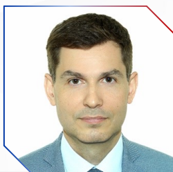
Денис Синявский Заместитель Губернатора, Министр экономического развития и промышленности Владимирской области