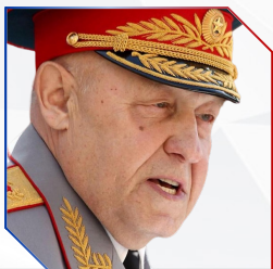
Юрий Балуевский Почетный Председатель конференции Генеральный инспектор Минобороны России