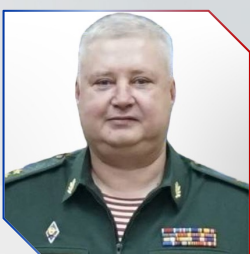
Глеб Курбатский Начальник УФСБ России по Федеральной службе войск национальной гвардии