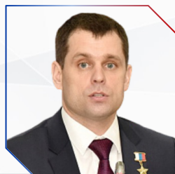
Максим Синявский Заместитель Начальника Управления Президента РФ по госполитике в сфере ОПК