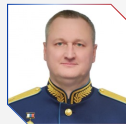
Юрий Веселов Врид руководителя ДИД Минобороны России