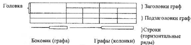
Рис. 2 – Пример оформления таблицы