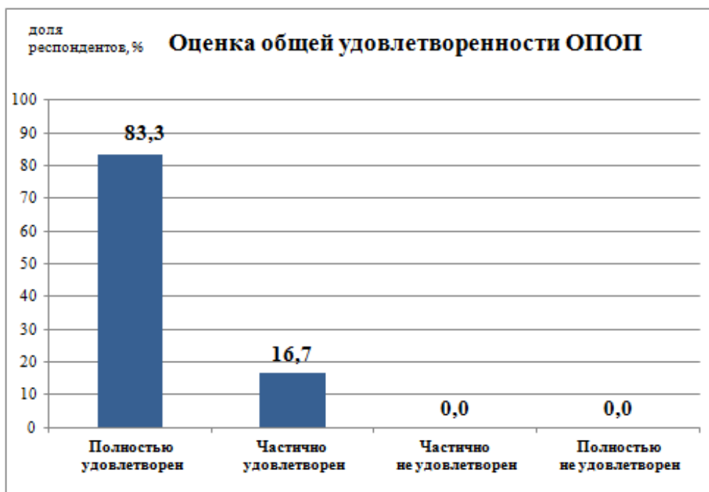
Рис.1 - Удовлетворенность обучающихся образовательной программой в целом

В ходе опроса обучающиеся высоко оценили общие характеристики вуза (инфраструктура, социально-культурные и бытовые условия, репутация) - средний балл 4,9 из 5. В числе ключевых положительных моментов студенты выделили: открытость информации о деятельности университета в соцсетях и мессенджерах; внеучебную жизнь, включающую разнообразные спортивные и культурные мероприятия для творческой самореализации. Респонденты выразили готовность рекомендовать университет родственникам и знакомым для получения профессионального образования.