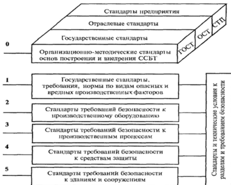
Рис. 1. Структура ССБТ

соответствующем государственном стандарте (снижение уровня требований в отраслевом стандарте по сравнению с требованиями в государственном федеральном стандарте не допускается). Такой же подход принят в стандартах предприятий (СТП). Взаимоподчиняемые подсистемы ССБТ представлены на рис. 1.