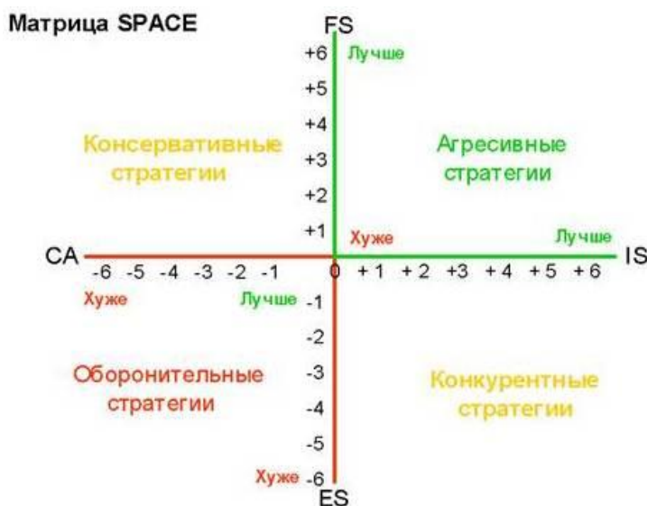
Рис. 5. Матрица SPACE

Графически SPACE модель обычно представлена в виде матрицы (рис. 5).