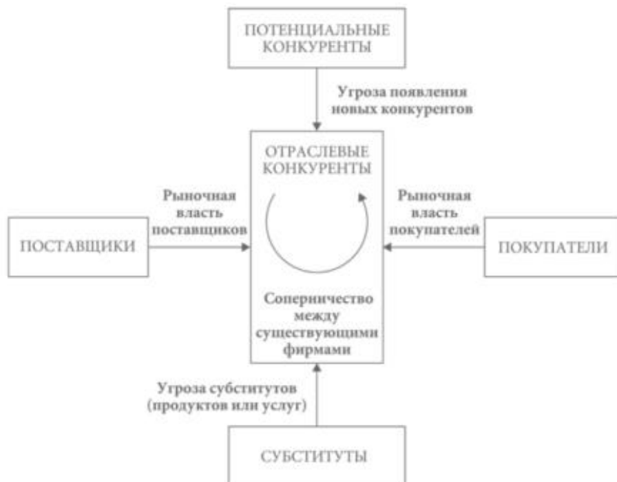
Рис. 2. Пять конкурентных сил М. Портера