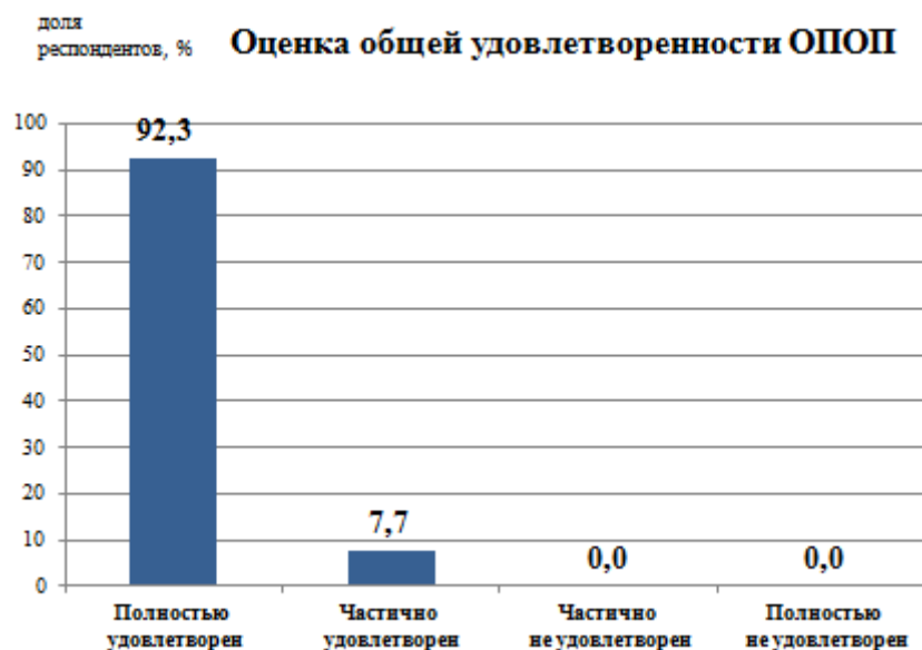
Рис.1 - Удовлетворенность обучающихся образовательной программой в целом

Общие характеристики вуза, включающие инфраструктуру университета, социально-культурные и бытовые условия, репутационные характеристики вуза, оценены респондентами высоко – средний балл 4,7 из 5 максимально возможных баллов. Большинство опрошенных обучающихся отметило, что в Университете доступны разнообразные спортивные и культурные мероприятия для творческой самореализации.