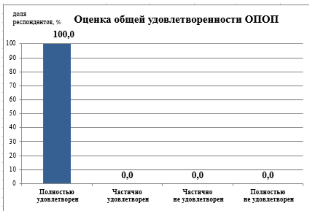
Рис.1 - Удовлетворенность обучающихся образовательной программой в целом

Университет получил наивысший балл (5 из 5) по всем ключевым аспектам: от бытовых условий и организации досуга до качества цифровых коммуникаций и репутации вуза. Это свидетельствует о комплексном подходе университета к созданию комфортной среды, и высокой степени доверия со стороны студентов.