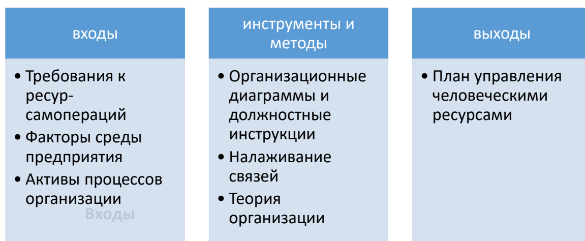
Рис. 2. Разработка плана управления человеческими ресурсам

Большое внимание должно уделяться рассмотрению доступности человеческих ресурсов или конкуренции за них, их дефициту или ограниченности. Роли в проекте могут быть назначены отдельным лицам или группам лиц. Данные лица или группы могут быть привлечены как из штата самой организации, исполняющей проект, так и из сторонних организаций; на ресурсы с тем же уровнем квалификации или тем же набором навыков могут претендовать другие проекты. Данные факторы могут значительно повлиять на стоимость, сроки, риски, качество и другие аспекты проекта. При эффективном планировании человеческих ресурсов следует учитывать и планировать данные факторы и разрабатывать альтернативные планы управления человеческими ресурсами.