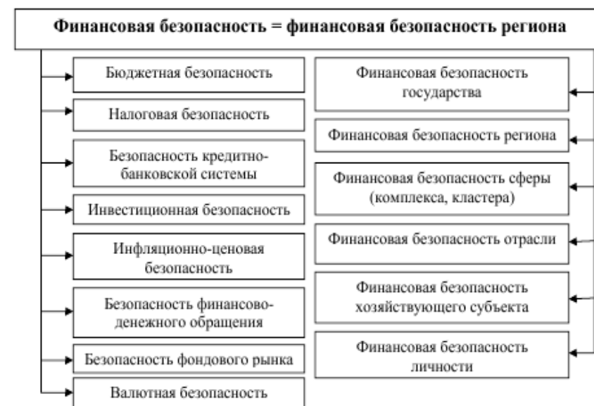
Рис. 1.3 Типы финансовой безопасности

Финансовая безопасность обладает собственным содержанием и позволяет выделить ее типологические особенности (рис. 1.3), скорректированные на проблематику направлений деятельности финансовой системы. Все элементы (типы) финансовой безопасности проецируемы на регион, взаимосвязаны между собой и взаимообусловлены друг другом, и ориентированы на обеспечение финансовой устойчивости.