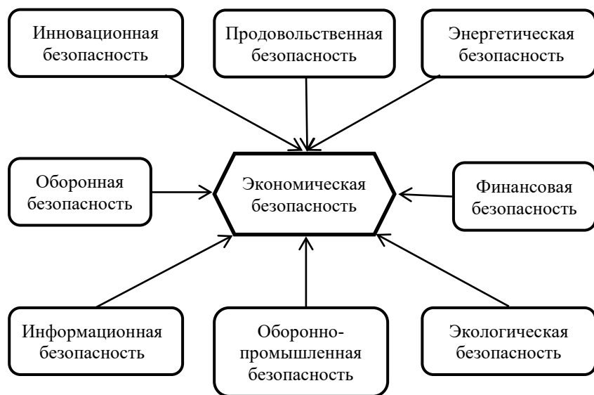
Рис. 1.1 Основные составляющие экономической безопасности в масштабе государства

В настоящее время для национальной экономики становится первоочередной инновационная безопасность. В понятие инновационной безопасности следует включать две взаимосвязанные и взаимодополняющие подсистемы: