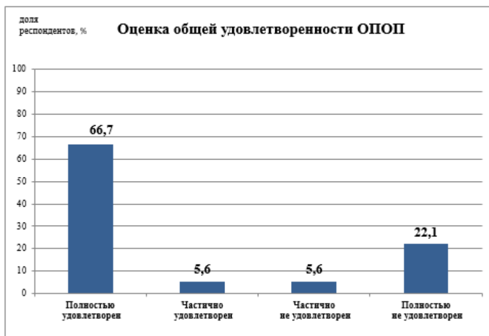
Рис.1 - Удовлетворенность обучающихся образовательной программой в целом

Показатели общих характеристик вуза, включающих инфраструктуру университета, социально-культурные и бытовые условия, репутационные характеристики вуза, оценены респондентами со средним баллом 4,2 из 5 максимально возможных баллов. Наибольший балл (4,7) получил показатель информационной открытости и доступности вуза в социальных сетях и мессенджерах.