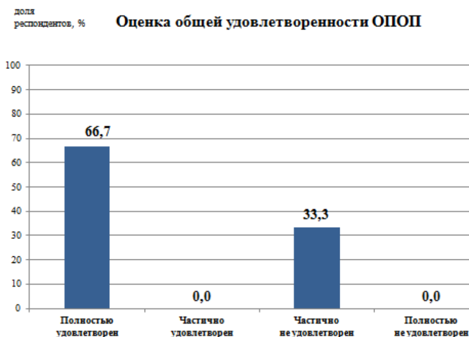
Рис.1 - Удовлетворенность обучающихся образовательной программой в целом

Общую удовлетворенность образовательной программой ( качество реализации программы и преподавательская деятельность в рамках этой ОП ) две трети опрошиваемых студентов оценили как полную, остальные – частично не удовлетворены (рис. 1).