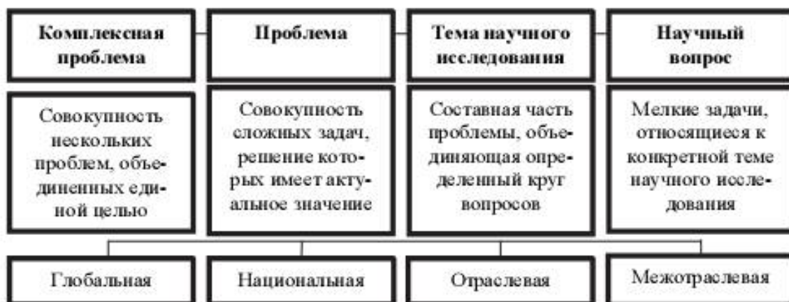
Рис. 1.2. Структурные единицы научного направления

Структурными единицами научного направления являются комплексные проблемы, темы и научные вопросы (рис. 1.2).