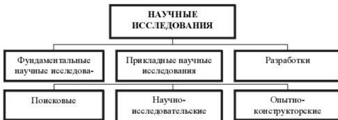
Рис. 1.1. Классификация научных исследований

Научные исследования по характеру связей с производством и степени важности для народного хозяйства, целевому назначению, источникам финансирования и длительности выполнения классифицируются на следующие основные виды: фундаментальные, прикладные и разработки (рис. 1.1).