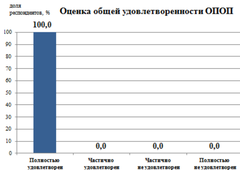
Рис.1 - Удовлетворенность обучающихся образовательной программой в целом

Оценка общих характеристик вуза, включающих инфраструктуру университета, социально-культурные и бытовые условия, репутационные характеристики вуза оценены респондентами высоко – средний балл 5 из 5 максимально возможных баллов. Опрошенные обучающиеся подтвердили, что готовы рекомендовать Университет и данную образовательную программу родственникам и знакомым, в Университете созданы все необходимые бытовые условия (столовые, общежитие, медпункт, организация досуга и т.п.).