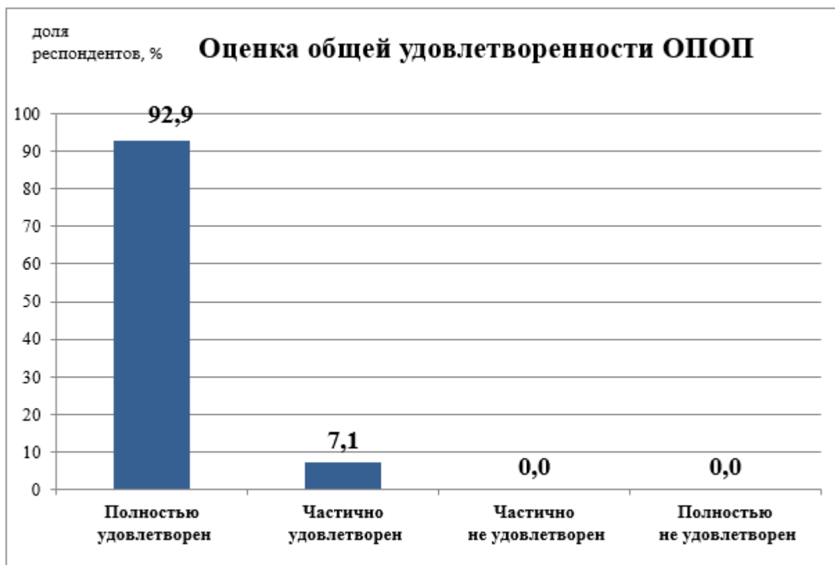
Рис.1 - Удовлетворенность обучающихся образовательной программой в целом

Оценка общих характеристик вуза, включающих инфраструктуру университета, социально-культурные и бытовые условия, репутационные характеристики вуза оценены респондентами достаточно высоко – средний балл 4,7 из 5 максимально возможных баллов. Респонденты особенно высоко оценили созданные в Университете бытовые условия и разнообразие спортивных и культурных мероприятий для творческой самореализации (максимальная оценка - 5 баллов).