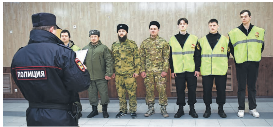
Регулярно к рейдам дружинников присоединяются и казаки

РЕПОРТАЖ • Корреспонденты «Коммуны» отправились в рейд с воронежскими дружинниками и помогли задержать хулигана