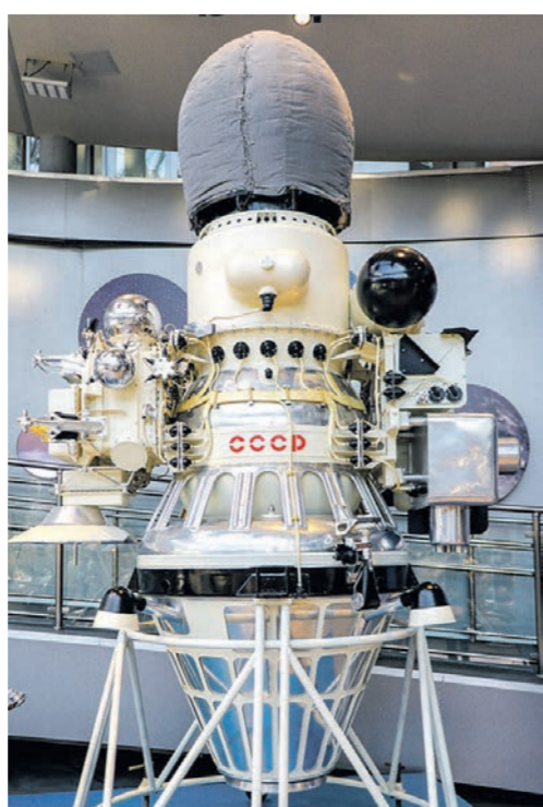
Успешное прилунение произошло в феврале 1966-го. Его совершила советская автоматическая станция «Луна-9» в районе океана Бурь.

«Луноход-3» планировали отправить на спутник в 1977-м. Однако миссию отменили. А недостаток финансирования и ряд технических просчётов привели к тому, что 17 февраля 1976 года советскую лунную программу официально закрыли, сделав ставку на продолжение полётов человека на околоземную орбиту, а также на запуск и поддержание работы собственных орбитальных космических станций. В 1975 году и Штаты завершили свою программу «Аполлон».