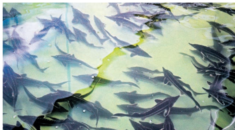
Новый корм будут давать осетровым, форелевым, сиговым и другим ценным видам рыб

Новый корм будут давать осетровым, форелевым, сиговым и другим видам ценных пород рыб. Ключевое отличие разработки воронежских учёных заключается в сниженном содержании рыбной муки. Её заменяют амарантовый жмых и автотрофные микроорганизмы, в частности, дрожжи и бактерии, которые синтезируют белки. Рецептура обогащена важными компонентами, такими как лизин, пробиотики, фитазы, минералы и бета-каротин. Последний компонент служит для улучшения окраски мышц форели и лосося. В результате корм получается сбалансированным по не-