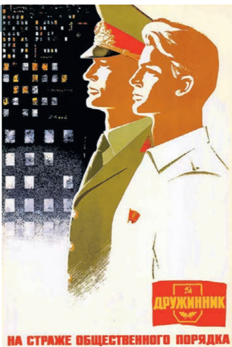
НА СТРАЖЕ ОБЩЕСТВЕННОГО ПОРЯДКА