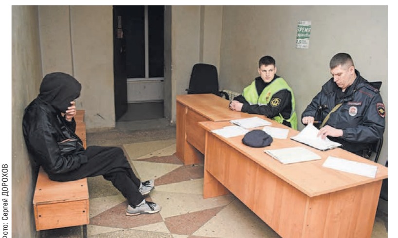
Благодаря бдительности студента-дружинника полицейским удалось задержать и доставить в участок нетрезвого хулигана

от полицейских, у дружинников не так много полномочий. Они не имеют права носить с собой оружие, а также надевать форму. А ещё им нельзя задерживать подозреваемого и применять к преступникам физическую силу. Проводить рейды добровольцам разрешается только в присутствии патрульных МВД. Но правоохранители уверены, что народные полицейские очень их выручают.