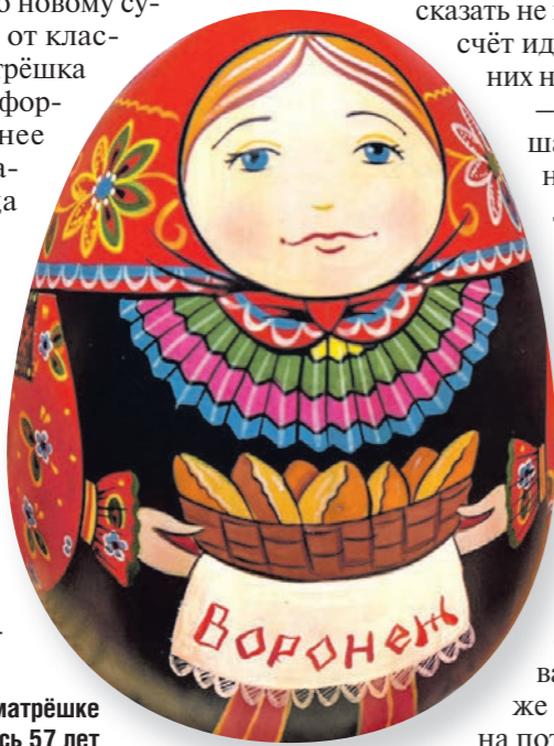
Воронежской матрёшке в этом году исполнилось 57 лет

6 В России работают шесть музеев, посвящённых матрёшке.