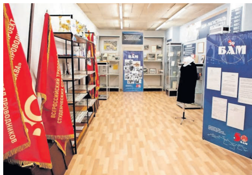
Сейчас в музее более 200 экспонатов

Уникальный для нашего региона музей «БАМ – магистраль мужества» открылся в Воронежском государственном техническом университете. Его в 2024 году на встрече с ветеранами-стройотрядовцами предложил создать вице-спикер Госдумы Алексей ГОРДЕЕВ.