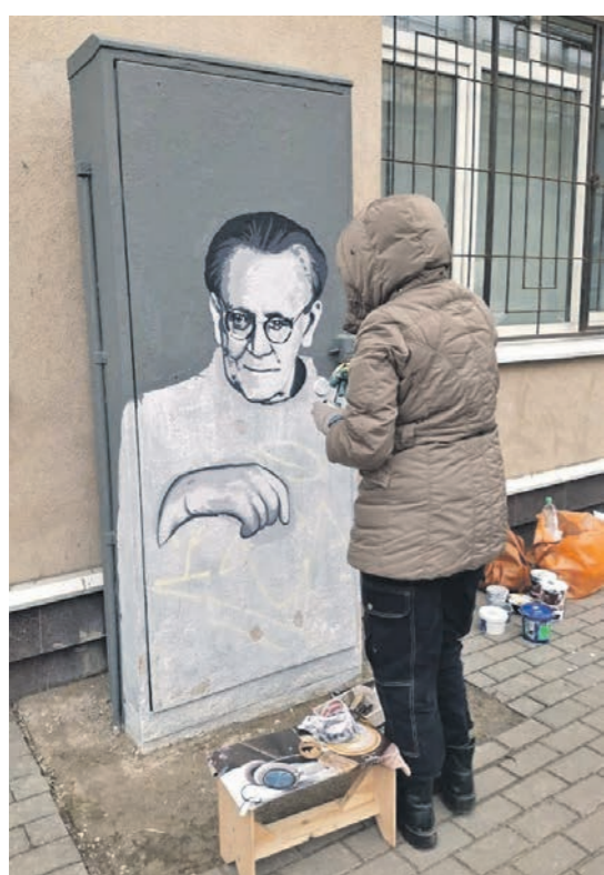
Шкаф на ул. Плехановской украсит портрет детского писателя Самуила Маршак