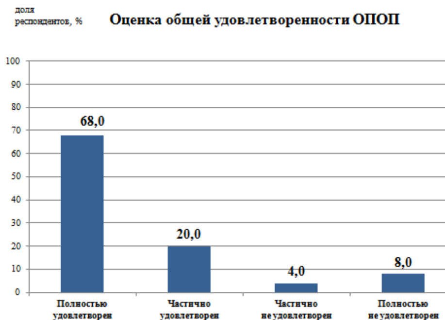
Рис.1 - Удовлетворенность обучающихся образовательной программой в целом

В целом качеством реализации образовательной программы удовлетворены (полностью или частично) 88% респондентов (рис.1).