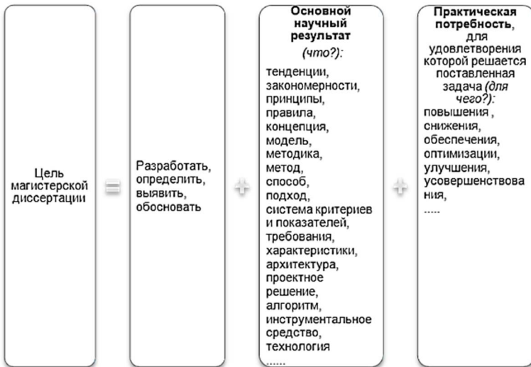
Рис. 1. Основные информационные блоки при формулировании цели магистерской диссертации

Формулировка цели магистерской работы отражает направление исследований и взаимосвязана с названием темы диссертации. В связи с поставленной целью формируются задачи в процессе магистерского исследования. Постановку задач необходимо делать как можно более тщательно, поскольку описание их решения и составляет содержание глав работы. Более того, название глав вытекают именно из формулировок задач. Основные информационные блоки при формулировании цели представлены на рис. 1.