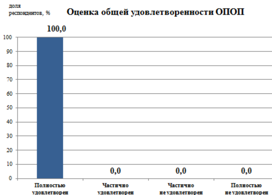
Рис.1 - Удовлетворенность обучающихся образовательной программой в целом

По результатам анкетирования в целом качеством реализации образовательной программы удовлетворены все опрошенные обучающиеся (рис.1).