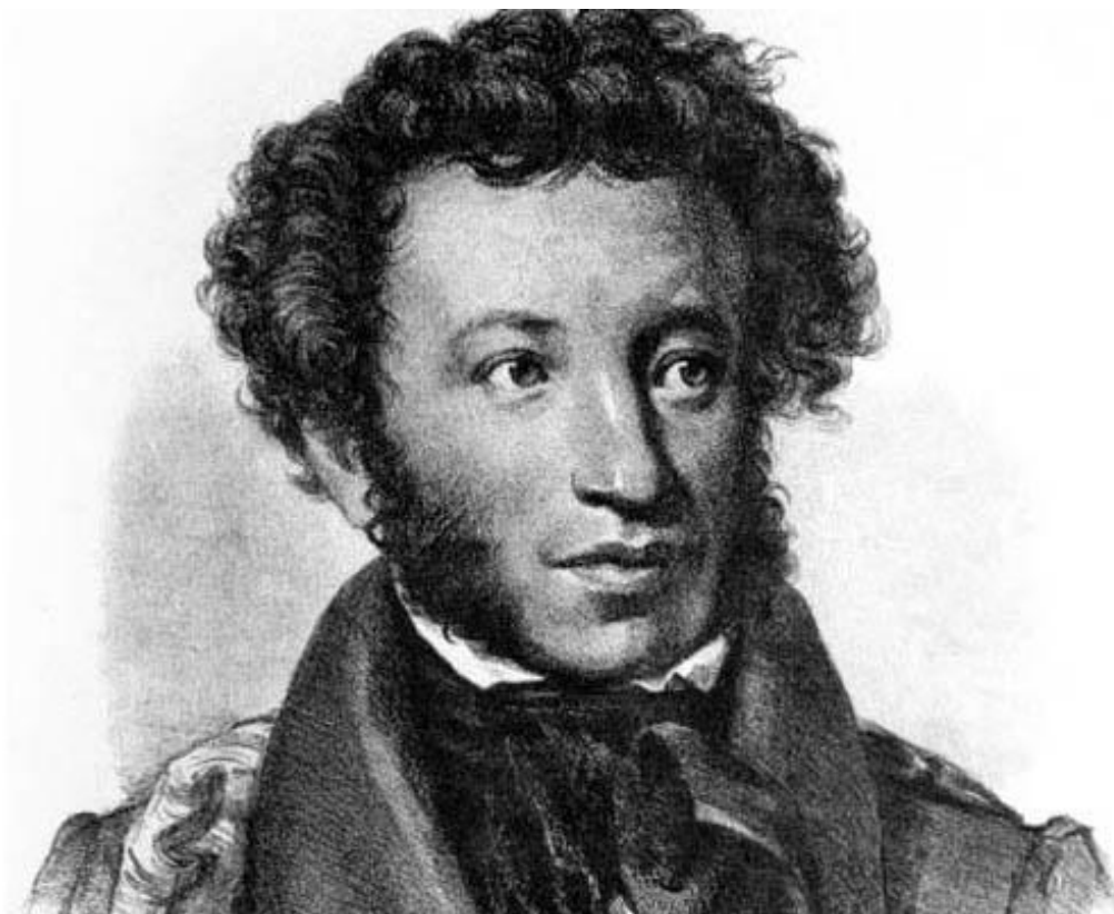
Рис.1. А.С. Пушкин

Александр Сергеевич Пушкин – самый любимый писатель в России. Его все знают, книги его все читают и перечитывают. Его стихи учат наизусть. Его