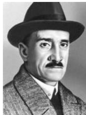
Рис. 5. А. Грин

Известный русский писатель А. Грин (псевдоним Александра Степановича Гриневского) (1880-1932) родился в семье ссыльного поляка – участника польского восстания 1863 года. В молодости А. Грин много скитался по России, был матросом, золотоискателем. Другой русский писатель Константин Паустовский писал о Грине: «Грин прожил тяжёлую жизнь. Всё в ней, как нарочно, сложилось так, чтобы сделать из Грина преступника или злобного обывателя.