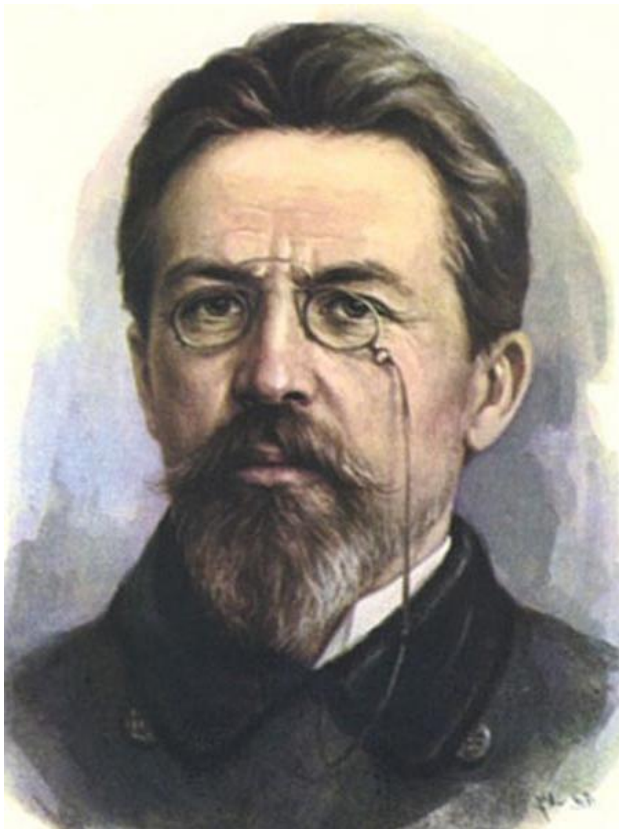
Рис. 3. А.П. Чехов

В русской и мировой литературе имя Антона Павловича Чехова – одно из самых любимых. Оно вызывает не только всеобщее признание, глубокое уважение, но и особенное чувство читательского доверия к писателю, чувство духовной близости.