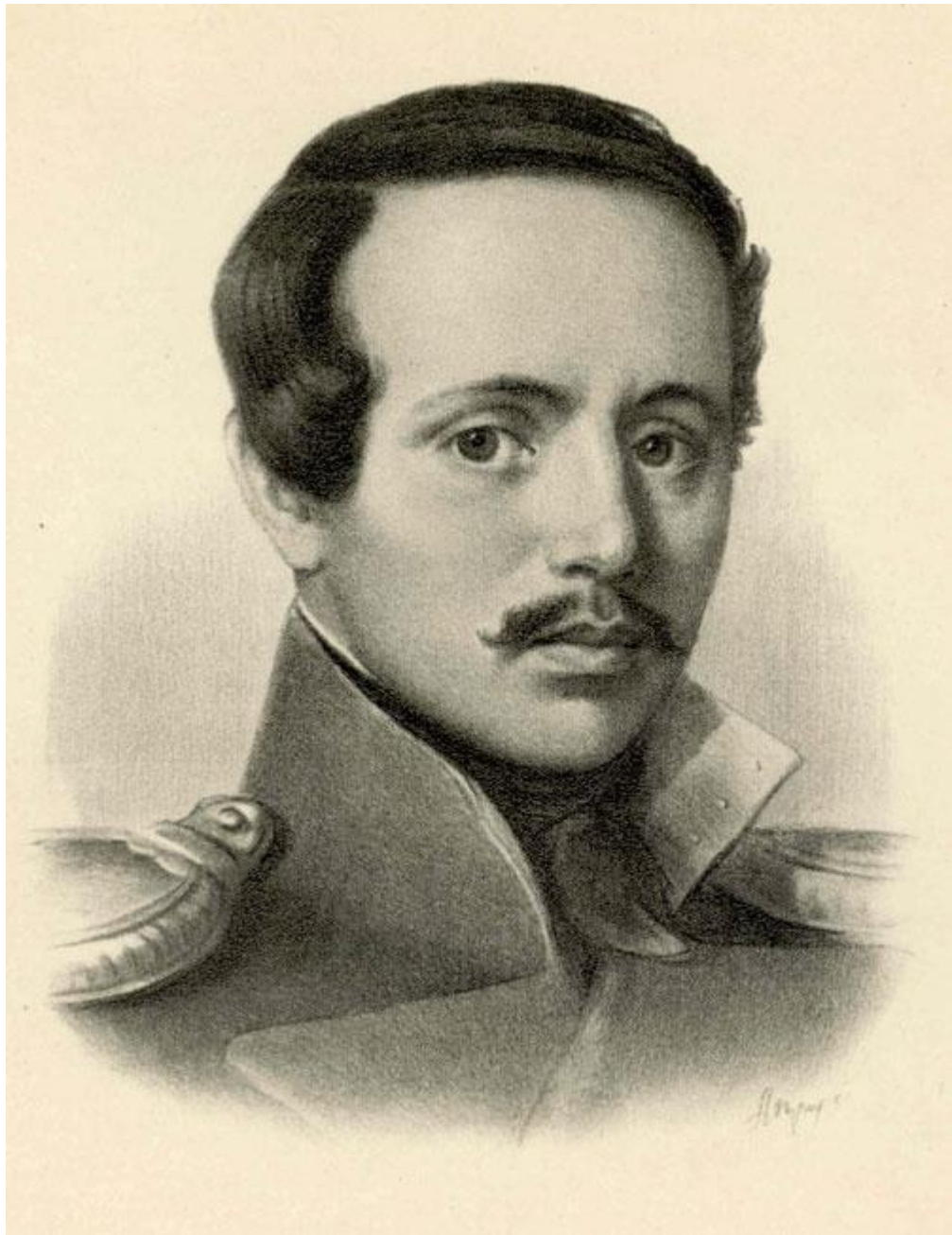
Рис.2. М.Ю. Лермонтов

В 1832 Лермонтов оставляет Московский университет и переезжает в Петербург, надеясь продолжить образование в Петербургском университете; однако ему отказались зачесть прослушанные в Москве курсы. Чтобы не начинать обучение заново, Лермонтов принимает совет родных избрать военное поприще; в ноябре 1832 сдает экзамены в Школу гвардейских подпрапорщиков и кавалерийских юнкеров и проводит два года в военно-учебном заведении, где строевая служба, дежурства, парады почти не оставляли времени для творческой деятельности.