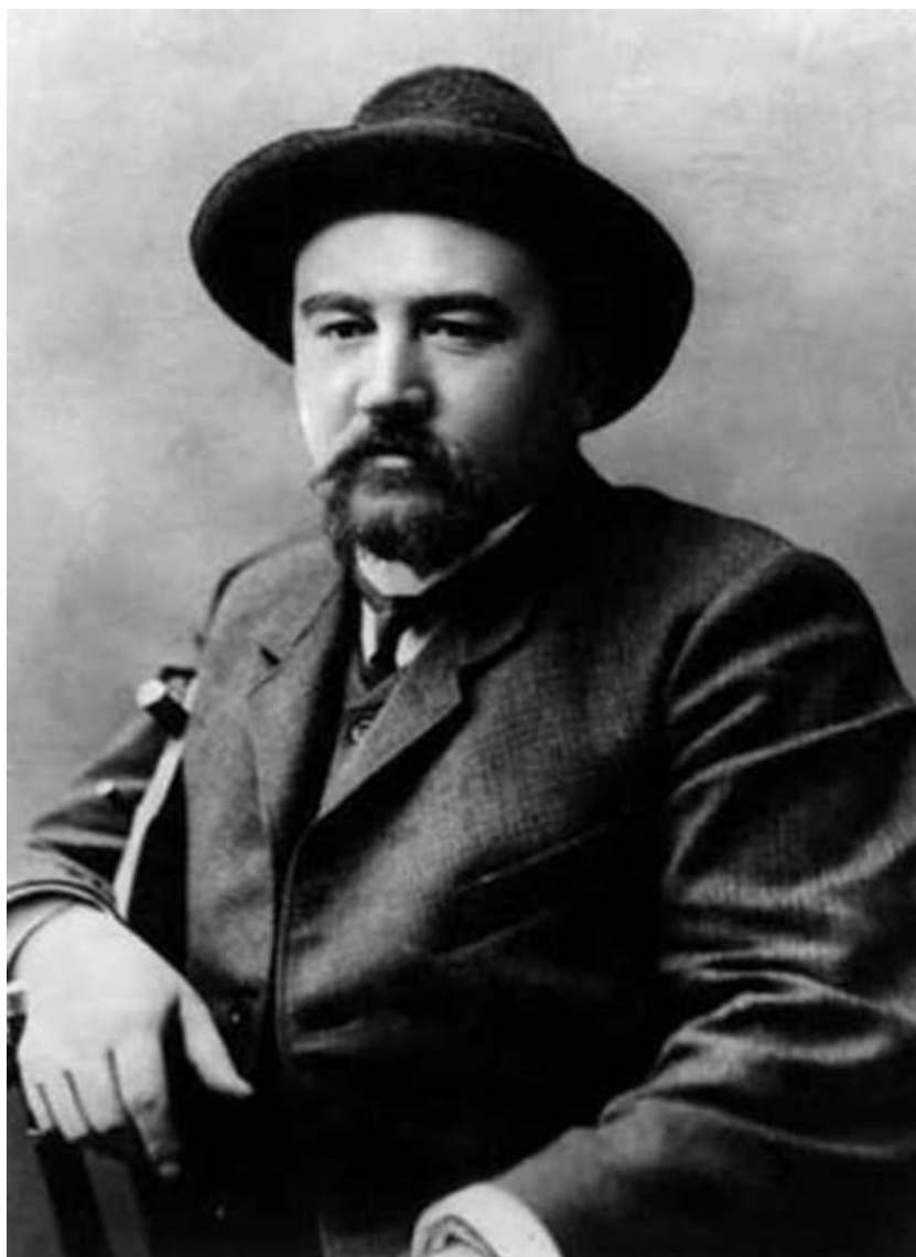
Рис. 4. А.И. Куприн

Уже в кадетском корпусе родилась настоящая, глубокая любовь будущего писателя к литературе. К этому времени Куприн начинает пробовать свои силы в поэзии. Сохранилось несколько его очень несовершенных ученических опытов 1883 -1887 годов. Уже будучи в юнкерском училище, Куприн впервые выступит в печати. Познакомившись с поэтом Л. И. Пальминым, он опубликовал в журнале "Русский сатирический листок" рассказ "Последний дебют" (1889). Но этот рассказ был не слишком удачен.