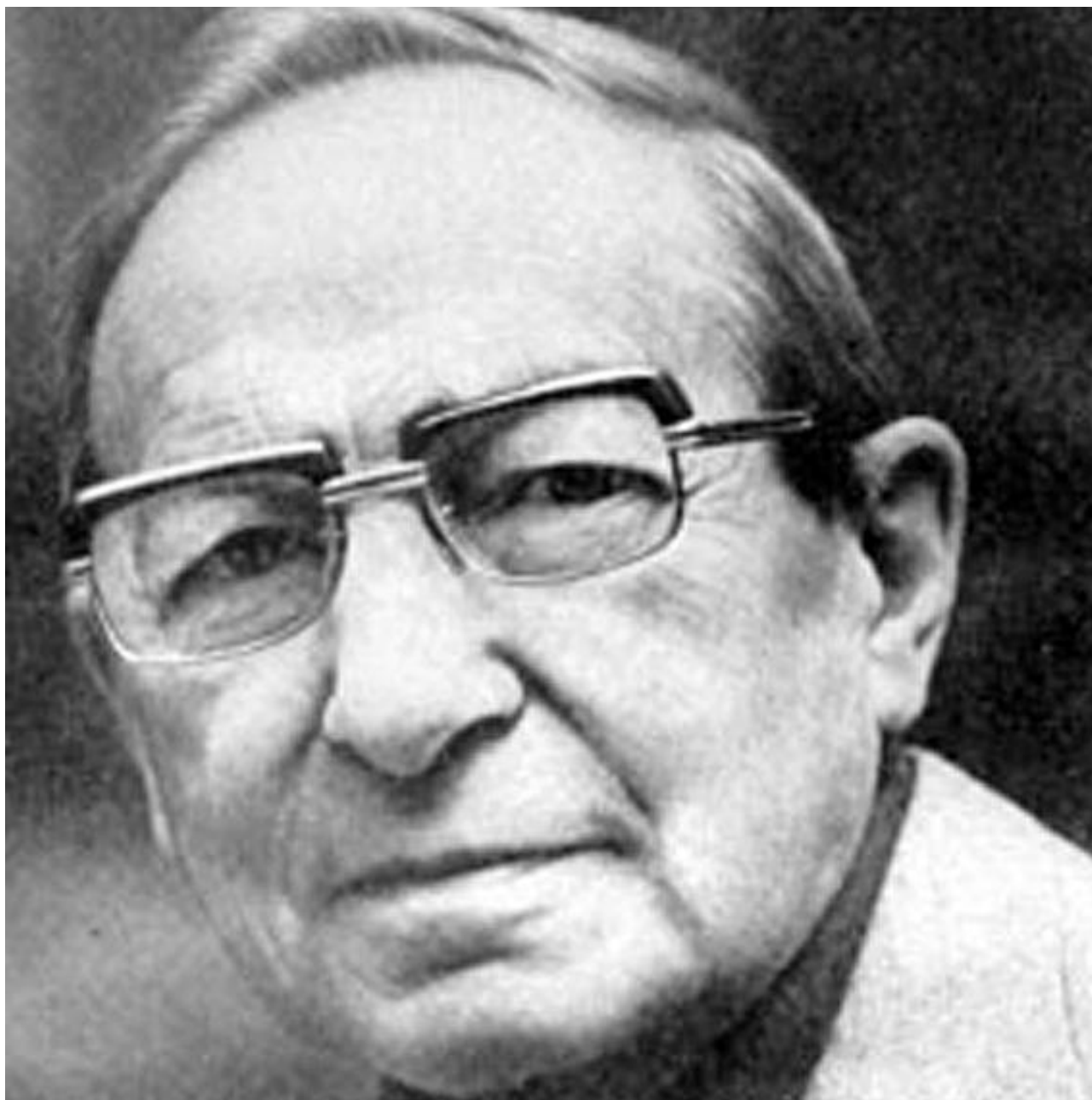
Рис. 8. В. Каверин.

Задание 2. В рассказе «Тициан» вы встретите много существительных, обозначающих военные названия. Познакомьтесь с толкованием следующих названий и терминов, запомните их.