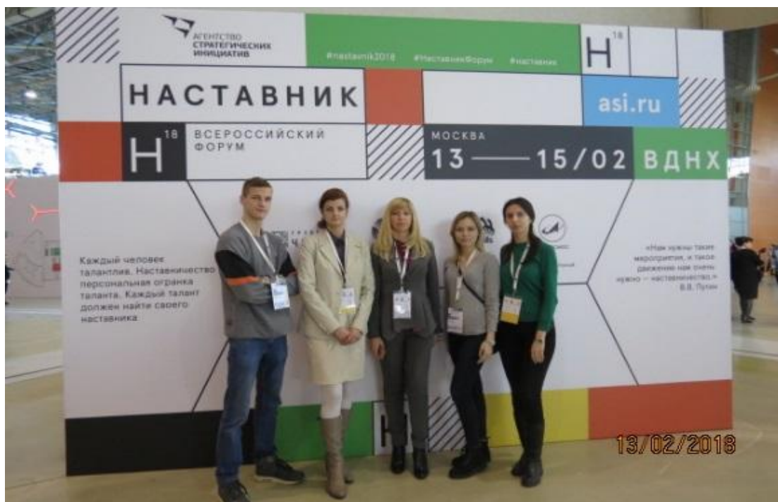
Рис. 3. Команда ЦРТМ на Всероссийском форуме "Наставник"

Небольшое послабление в режиме самоизоляции позволило участникам ЦРТМ выступить в качестве экспертов в рамках игры «Проектогенерация», которая проводилась как один из этапов конкурса на замещение вакантных должностей в составе молодежного правительства Воронежской области (октябрь 2020 года).