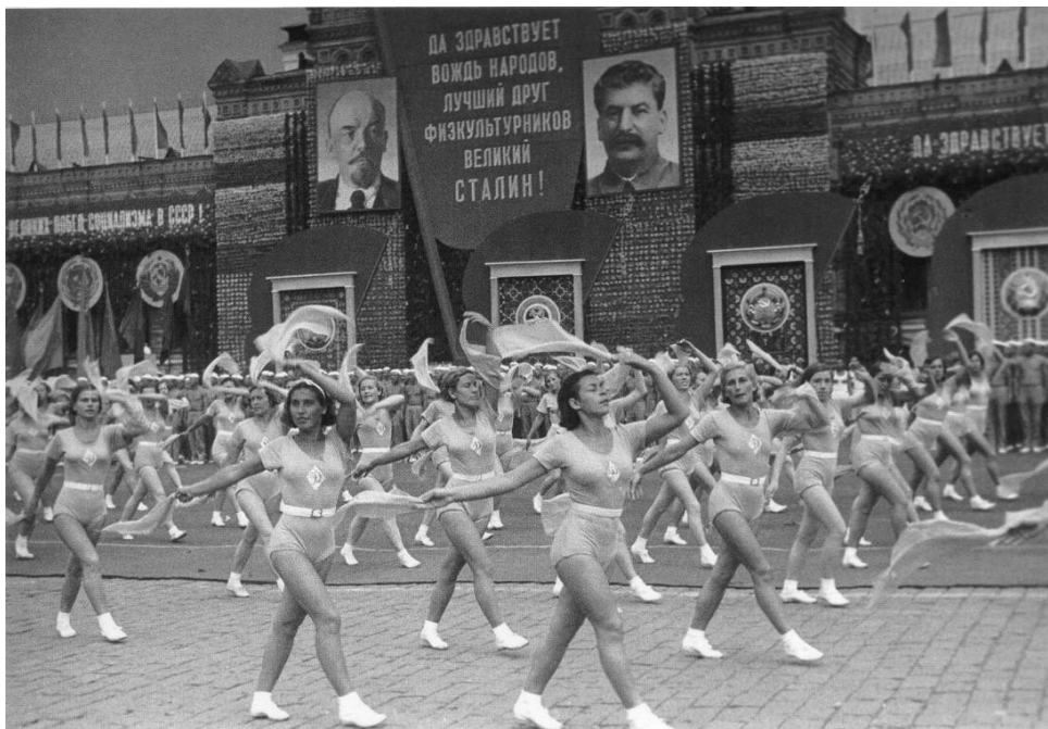
Рис. 2. Спортивный парад, СССР, 1930-ые гг.

Отметим, что одним из видов гулянья были – тематические праздники. На этих мероприятиях места, в которых они проводились, украшали по теме праздника, например, День кино, День книги. Важным видом праздников являлись – праздники профессий. В данных мероприятиях участвовали не только виновники торжества, но и также их члены семьи. Своего расцвета достигли спортивные праздники, которые проводились на стадионах, парках. Это привлекало население к здоровому образу жизни. Наиболее ярко выраженным элементов данных праздничных спортивных мероприятий стали парады (рис. 2).