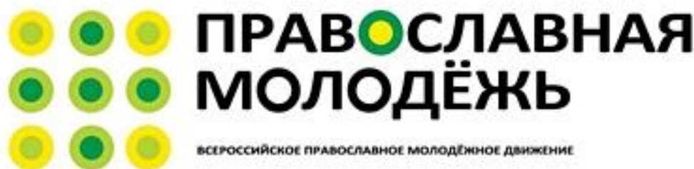
Рис. 1. Эмблема всероссийского православного молодёжного движения

До 1990 года активной деятельности по координированию духовно-нравственного развития молодых людей не осуществлялось, пока в декабре 1990 года не было принято решение о создании Синодального Отдела по делам молодёжи Русской Православной Церкви. Тогда же и зародилась идея создания единой молодёжной церковной организации. В декабре 1990 года Священный Синод благословляет проведение Съезда православной молодёжи. Он был открыт 25 января 1991 года в Москве, в его работе принял участие Патриарх Алексий II и делегаты от всех епархий Русской Православной Церкви [3]. Съезд также посетили представители «Русского Студенческого Христианского Движения», Всемирного движения православной молодёжи «Синдесмос» и иных зарубежных молодёжных христианских организаций. К итогам съезда можно отнести принятие решения о создании Всецерковного православного молодёжного движения (ВПМД) (рис.1)