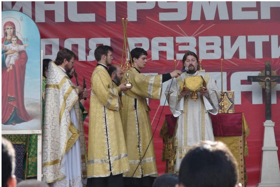
Рис. 3. Всероссийский молодежный образовательный форум «Селигер-2009»