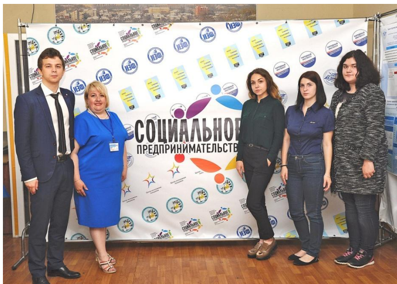
Рис. 4. Всероссийский форум «Проблемы и перспективы развития социального предпринимательства»