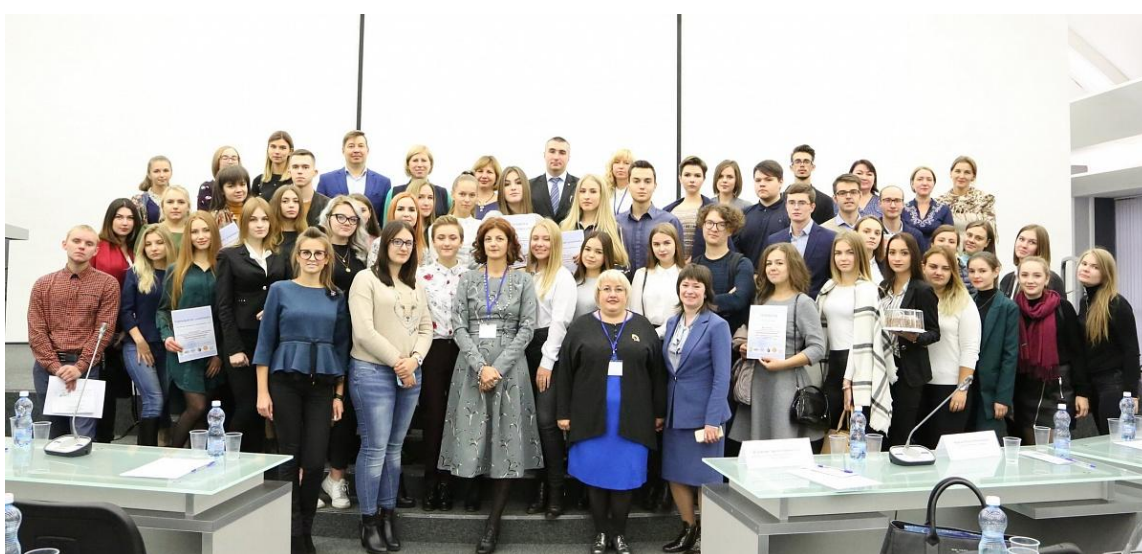
Рис. 8. Фестиваль по нетворкингу и университетский этап Всероссийского чемпионата по Национальной аналитической игре «Проектогенерация»

26-27 сентября 2018 года совместно с Межрегиональной общественной организацией содействия развитию перспективных проектов в области социально-экономического развития и создания социальных лифтов «Объединение наставников» и Росмолодежи на базе ВГТУ были проведены Фестиваль по нетворкингу и университетский этап Всероссийского чемпионата по Национальной аналитической игре «Проектогенерация» (рис. 8).