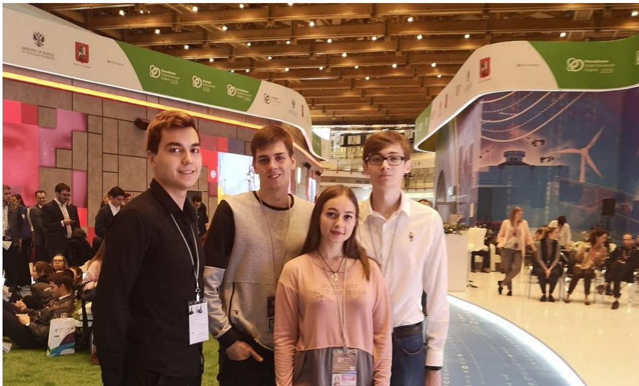
Рис. 1. Резеденты ЦРТМ на РЭН- 2019