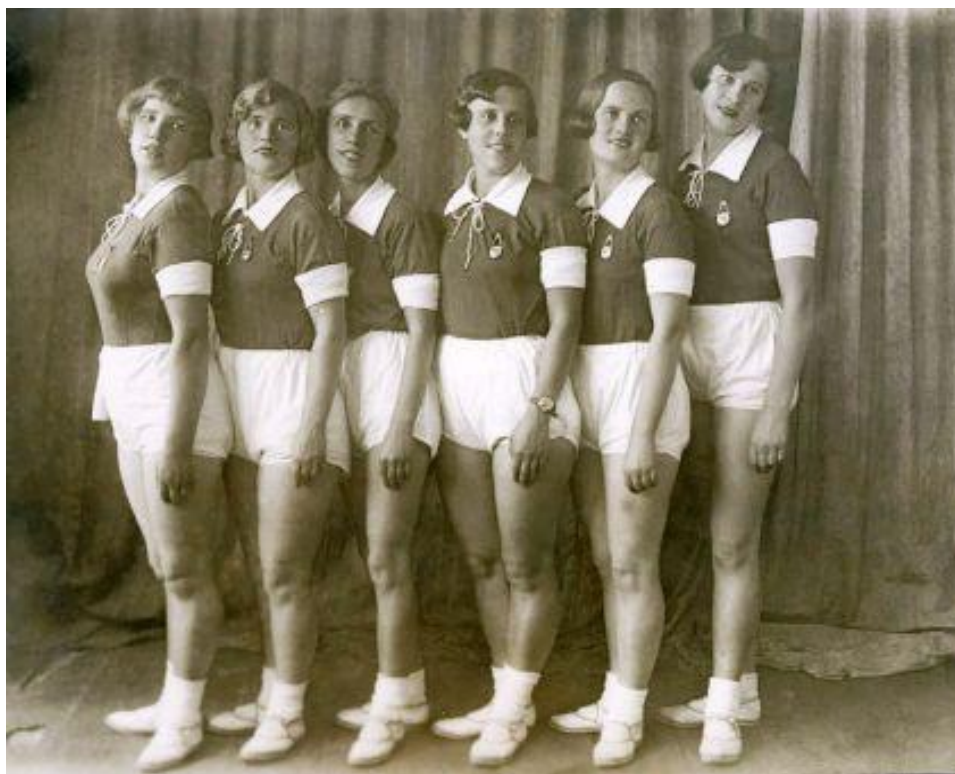
Рис. 1. Работницы фабрики офсетной печати. Ленинград, 1934 г.

С середины 1930-х годов становится модным спортивный стиль. Свободная одежда с накладными карманами, юбки с высокой талией. Также были модными удлиненные жакеты с карманами, жакеты с баской, узкая юбка с разрезом и складками. В моду вошли узко выщипанные брови, хорошо уложенные волосы, ношение различных видов украшений: бусы, брошки (рис. 1).