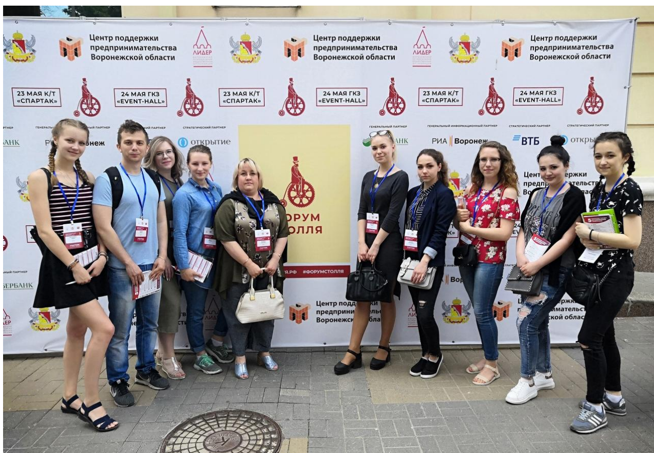
Рис. 2. Ежегодный региональный воронежский предпринимательский форум им. Вильгельма Столля