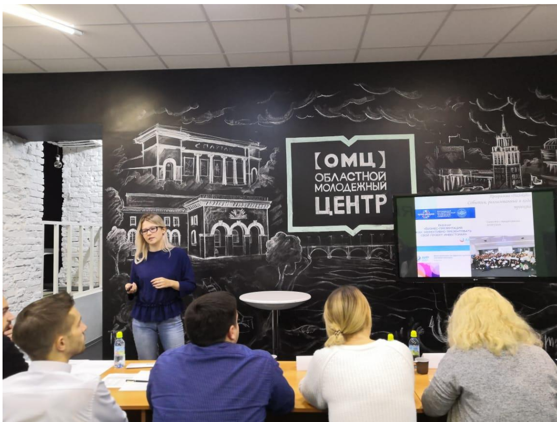
Рис. 6. Защита проекта профориентации «HasSkills» в рамках заключительного этапа VIII Конкурса премий Молодежного правительства Воронежской области [8]

Одним из самых ярких событий в жизни резидентов ЦРТМ ВТГУ были поездки в Йошкар-Олу, где уже в течении двух лет ( 2018 и 2019 годах) они приняли участие в IV и V Всероссийском студенческом форуме «Инженерные кадры – будущее инновационной экономики России» (рис. 7). Форум является встречей лидеров и экспертов, которые формируют повестку кадровой политики в подготовке технических специалистов и развитии инженерного образования РФ, с передовым студенчеством нашей страны. Проекты, проложенные резидентами Центра получали высокую оценку жюри форума и становись его призерами [8-13]