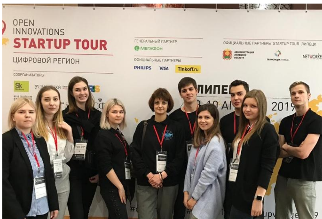
Рис. 5. Конкурс Open Innovations Startup Tour «Цифровой регион»