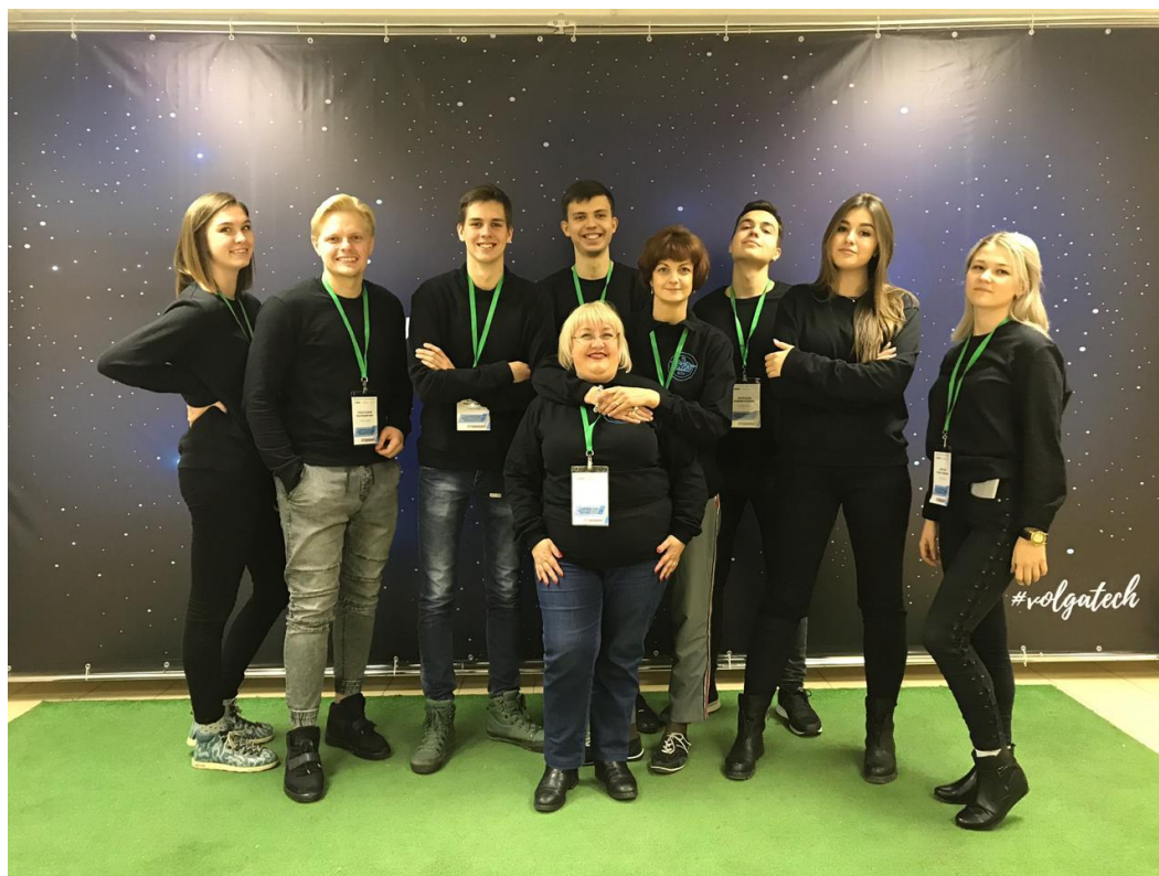
Рис. 7. Всероссийский студенческий форум «Инженерные кадры – будущее инновационной экономики России»

ЦРТМ ВГТУ принимает активное участие в общеузовских мероприятиях, а также инициирует их проведение и помогает в организации.