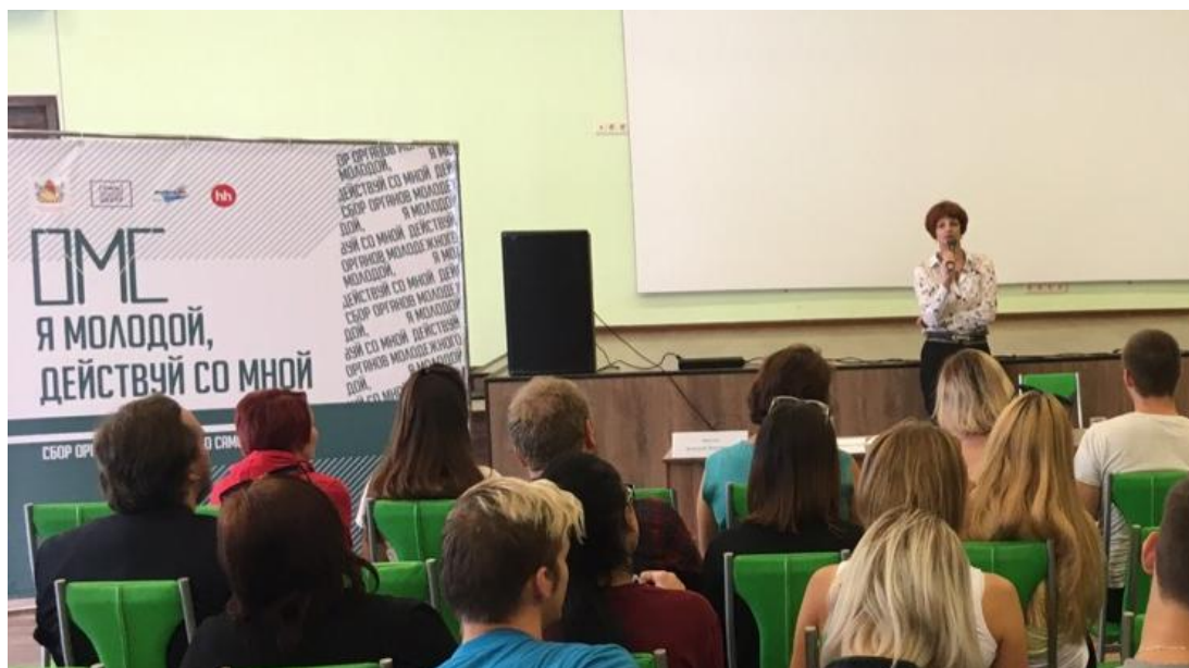
Рис. 12. Сбор органов молодежного самоуправления ВО

Также она является одним из экспертов, которые участвуют в проекте ргоБЮДЖЕТ, который направлен на повышение уровня финансовой грамотности молодежи.