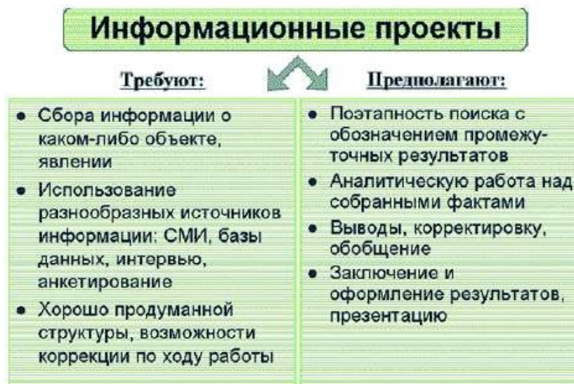
Рис. 1. Работа над информационным проектом

Работа над информационным проектом может исходить из обозначенного на рис. 1 подхода.