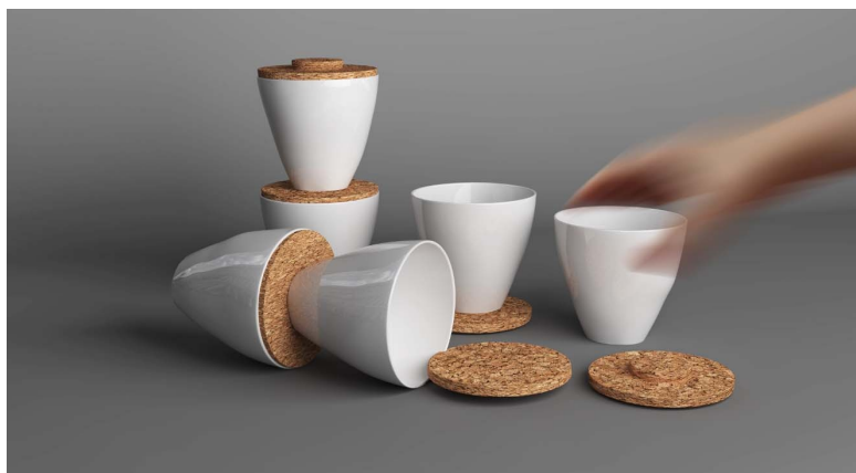
Рисунок 1 – «hills & hollows» проект комплекта чайного сервиза