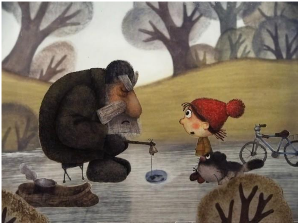
Рис. 1.2.4. Мультфильм «The Tiny Fish» 2008 г. Анимация перекладка.