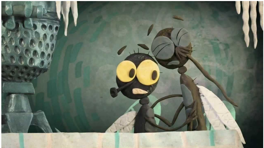
Рис. 1.2.3. Фрагмент из мультфильма «Гора самоцветов: Теремок». Пластилиновая анимация.