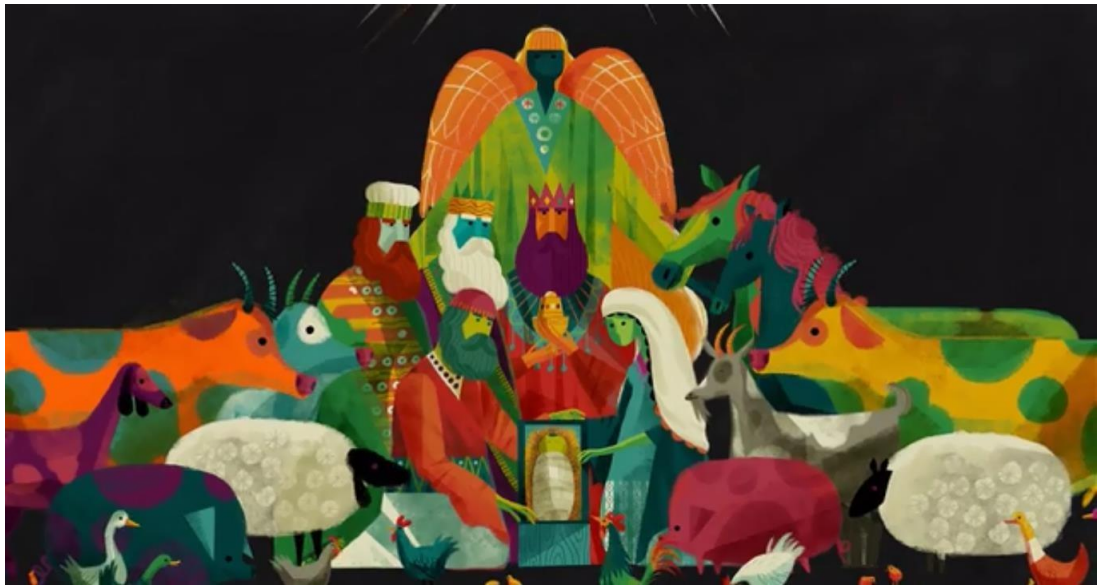
Рис. 2.1.14. Анимационный короткометражный фильм - «Самая большая история».