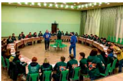
Окончание. Начало на 7-й стр.

просторы Крыма – педагогический отряд «Звездный» все лето будет работать в дет-