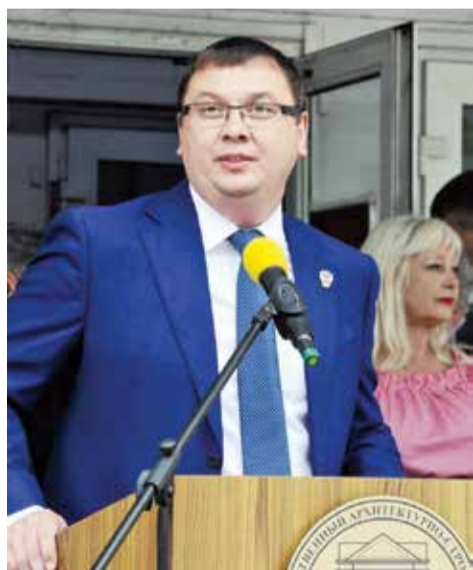
Торжественный митинг открыл ректор ВГТУ

Чествование лучших выпускников 2017 года состоялось в Воронежском техническом университете 12 июля. Каждый из лучших не просто окончил вуз с отличием, но также внес существенный вклад в его развитие, проявил себя в науке, творчестве, спорте, общественной жизни и заслужил право называться лучшим по профессии по итогам конкурсов квалификационных работ.