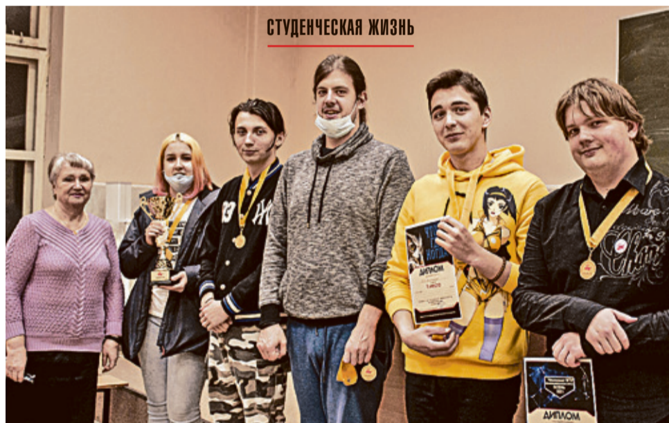
Команда ФРТЭ «Б/У Александров» — победитель Чемпионата интеллектуальных игр «Осень-2021»

Самые «ожесточенные» бои на этот раз развернулись в игре «Ворошиловский стрелок». И здесь первое место отстояла команда-победитель прошлого сезона — «Кролик Роджер» (сборная ФИСИС, СФ, ФМАТ); второй стала команда «Б/У Александров» (ФРТЭ), а третьей «Гуси ПМС» (ФИТКБ). В финальной игре «Мы Интеллектуалы» встретились 7 сильнейших. Были разыграны 24 вопроса. И на этот раз «Б/У Александров» оказалась впереди. В спор призеров вмешалась и очень сильная команда со скромным названием «Слабое звено». «Кролик Роджер» подвинулся на третье место. Команда «Б/У